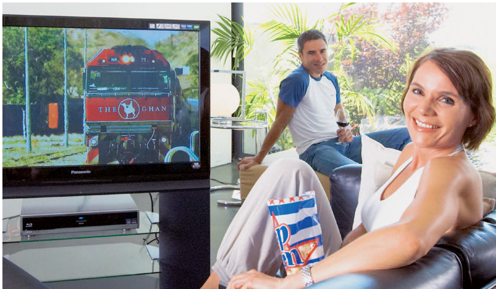
Hochauflösendes Fernsehen bietet eine fünfmal höhere Bildinformation als digitales TV

Das Schweizer Fernsehen wird ab 2012 seine Hauptsender auch in HDTV (hochauflösendes Fernsehen) ausstrahlen. Diese Umstellung bringt viele Vorteile und stellt auch einige Herausforderungen an die Kabelnetze.