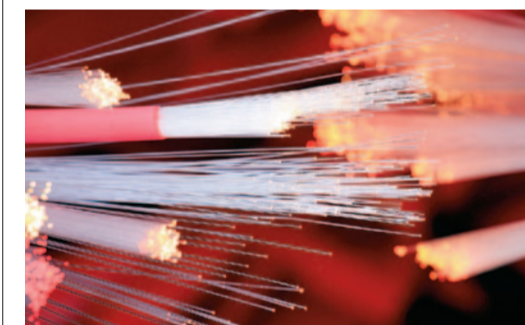
Kabelnetz Widnau: Die Glasfasernetze lassen sich schrittweise erweitern

Experten schätzen in einer internationalen Studie, dass die durchschnittliche Bandbreite in Europa im Jahr 2030 nicht mehr als 400 Mbit pro Sekunde betragen wird. Diese Bandbreite wird mit der modernen HFC-Technologie heute schon erreicht. Das heisst: Auf dem aktuellen Ausbaustand ist das Kabelnetz Widnau heute schon bereit für das, was die Multimedia-Welt von morgen bietet. Zum Beispiel für hochauflösendes Fernsehen HDTV oder für ultraschnelles Internet. Auch wenn die digitale Welt eines Tages noch höhere Netzkapazitäten verlangt, ist und bleibt das Kabelnetz Widnau die optimale Lösung.