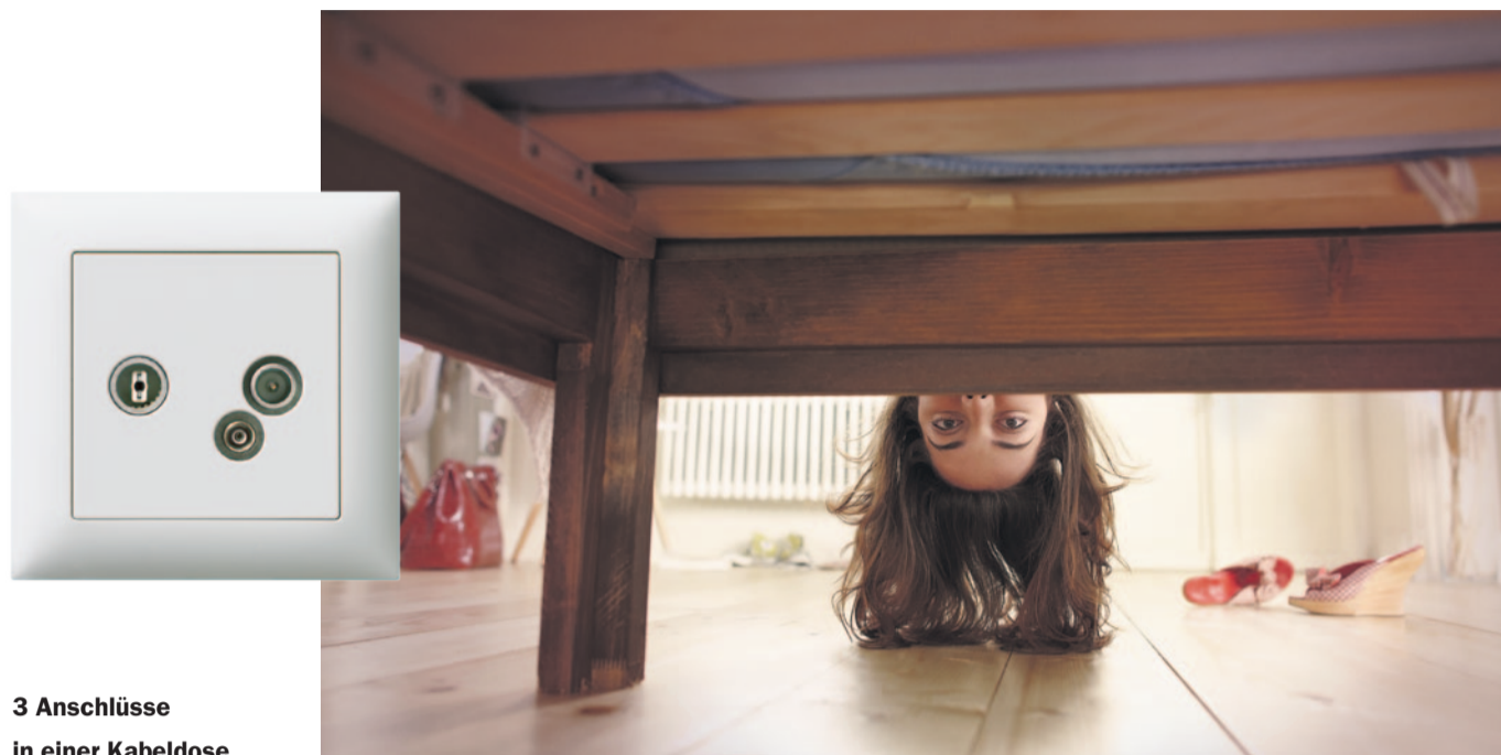
3 Anschlüsse in einer Kabeldose