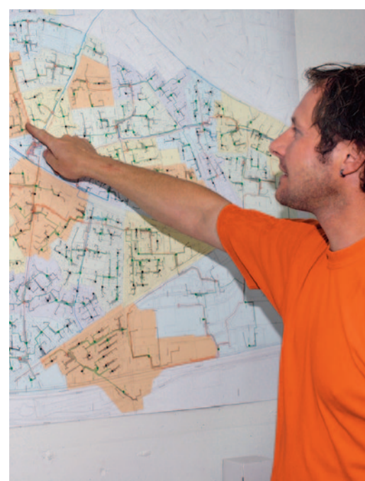
Das Widnauer Kabelnetz ist rund 200 Kilometer lang